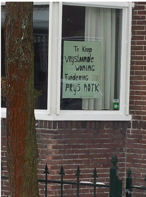
Figuur 1 Een herstelde fundering als verkoopargument in Zaanstad

De notitie bevat aanbevelingen voor alle betrokken partijen om de financiële belemmeringen en stagnatie van funderingsherstel als gevolg daarvan weg te nemen of te verminderen. Voor een deel wordt een beroep gedaan op de Rijksoverheid, maar de notitie bevat ook aanbevelingen voor lokale overheden, corporaties en financiers.