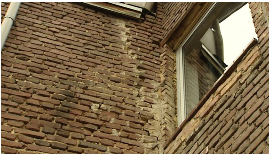
Figuur 4 Funderingsproblemen door mijnbouw in Rimborg (gemeente Landgraaf)

Er kan met succes bezwaar worden gemaakt tegen de hoogte van de WOZ-aanslag. Een bezwaarschrift blijkt echter een negatief effect te hebben op de beoordeling van de leningaanvraag. Wanneer er bezwaar wordt gemaakt wordt de eerder vastgestelde waarde voorlopig 'geschrap't'. Dat wil zeggen dat de gemeente ook geen WOZ-waarde meer afgeeft aan SVn ten behoeve van de beoordeling. In dat geval is er een taxatie nodig, waarvoor de eigenaar kosten moet maken, die in dezelfde orde van grootte liggen als de WOZ-belasting. Het KCAF heeft in verband met een project, dat mede om deze reden stagneerde, met de gemeente Rotterdam gesproken over de mogelijkheid om in deze gevallen toch de oorspronkelijke WOZ-waarde door te geven. Dit wordt nog binnen de gemeente bekeken.