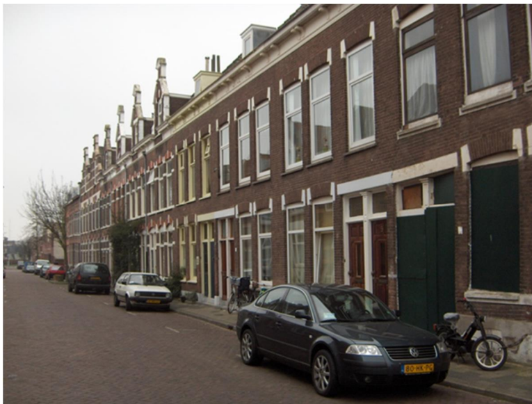
Figuur 5 Stagnerende aanpak Martinus Steijnstraat Dordrecht

F3O heeft zeer recent het initiatief genomen om een voorzichtige aanzet te maken voor een database. Het KCAF zou echter graag zien dat de informatie, met name waar het gaat om de locatie, specifiek wordt. Bovendien is het KCAF er voorstander van dat deze informatie ook voor derden beschikbaar komt. In die zin heeft het KCAF ook gereageerd op het voorstel van F3O en gaat daar nader over in gesprek.