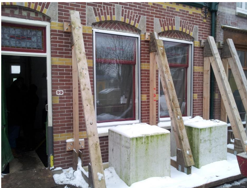
Figuur 3 Schrikbeeld voor gemeenten e eigenaren: ingreep met bestuursdwang (Zaanstad)

In bijna alle gevallen dienen de maatregelen in samenhang te worden getroffen. Het KCAF neemt waar mogelijk het voortouw om partijen bij elkaar te brengen om oplossingen tot stand te brengen. Een deel van de voorstellen is inmiddels besproken met enkele stakeholders. Bij de betreffende voorstellen is dat aangegeven en zijn de reacties in de voorstellen verwerkt.