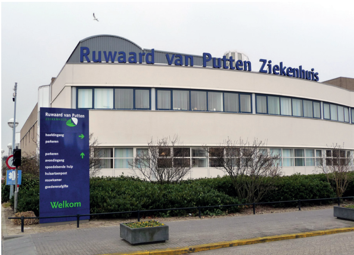
Figuur 1: Ruwaard van Putten Ziekenhuis.

De aanleiding voor dit onderzoek was de sluiting van de afdeling cardiologie van het voormalige Ruwaard van Putten Ziekenhuis in november 2012 op last van de IGZ. In de aanloop naar deze gebeurtenis had het ziekenhuis al geconstateerd dat bij bepaalde cardiologische aandoeningen sprake was van verhoogde en vermijdbare sterfte. De sluiting leidde tot vragen in de samenleving over de veiligheid van de zorg en meer specifiek over het gebruik van morfine bij terminale hartpatiënten.