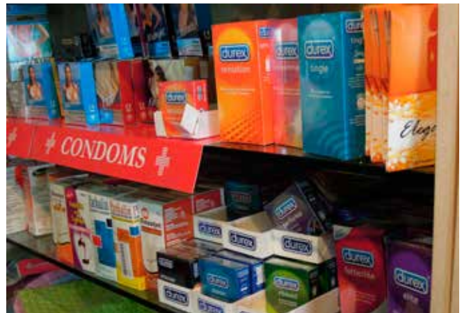
Nigeria, condoms (Esther Jurgens, 2011)

Op het gebied van HIV/Aids preventie heeft Nederland er aan bijgedragen dat jongeren beter op de hoogte zijn van de risico's van Aids. Ook zijn er meer middelen beschikbaar ter bescherming tegen HIV besmetting en is het aantal HIV behandelingen toegenomen. In