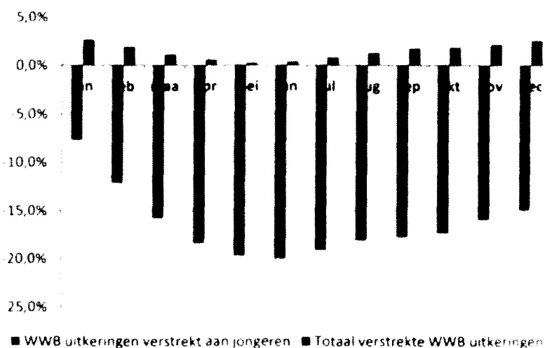
Figuur 3.1 Mutatie aantal bijstandsuitkeringen in 2012 t.o.v. van dezelfde maand in 2011

Cijfers van het CBS geven een indicatie dat de aangescherpte uitkeringsvoorwaarden voor jongeren er toe leiden dat minder jongeren een beroep doen op de WWB. De ontwikkeling van het aantal bijstandsuitkeringen verstrekt aan jongeren laat sinds de introductie van deze maatregelen een forse daling zien (zie figuur 3.1). Deze ontwikkeling is tegengesteld aan de landelijke trend dat het totaal aantal verstrekte WWB uitkeringen juist toeneemt.