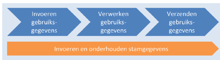
Figuur A Processtappen antibioticumregistratie door dierenarts

Deze processtappen zijn hieronder schematisch weergegeven: