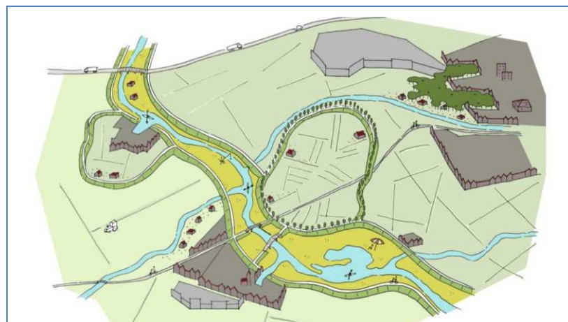
Figuur 2.3 Impressie van de relatie tussen bebouwd en onbebouwd gebied.

Figuur 2.3 laat toont de verhouding tussen de kernen en het omliggende groen. Om verrommeling van het buitengebied te voorkomen worden de identiteiten van platteland en bebouwing van dorpen en steden duidelijker geaccentueerd.