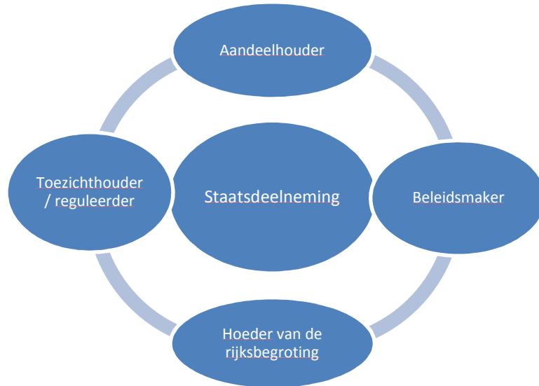
Figuur 1 Staatsdeelneming en de overheid