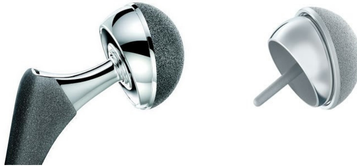
Figuur 1. Links een 'totale heupprothese' en rechts een 'resurfacing prothese' (bron: DePuy/Johnson & Johnson)