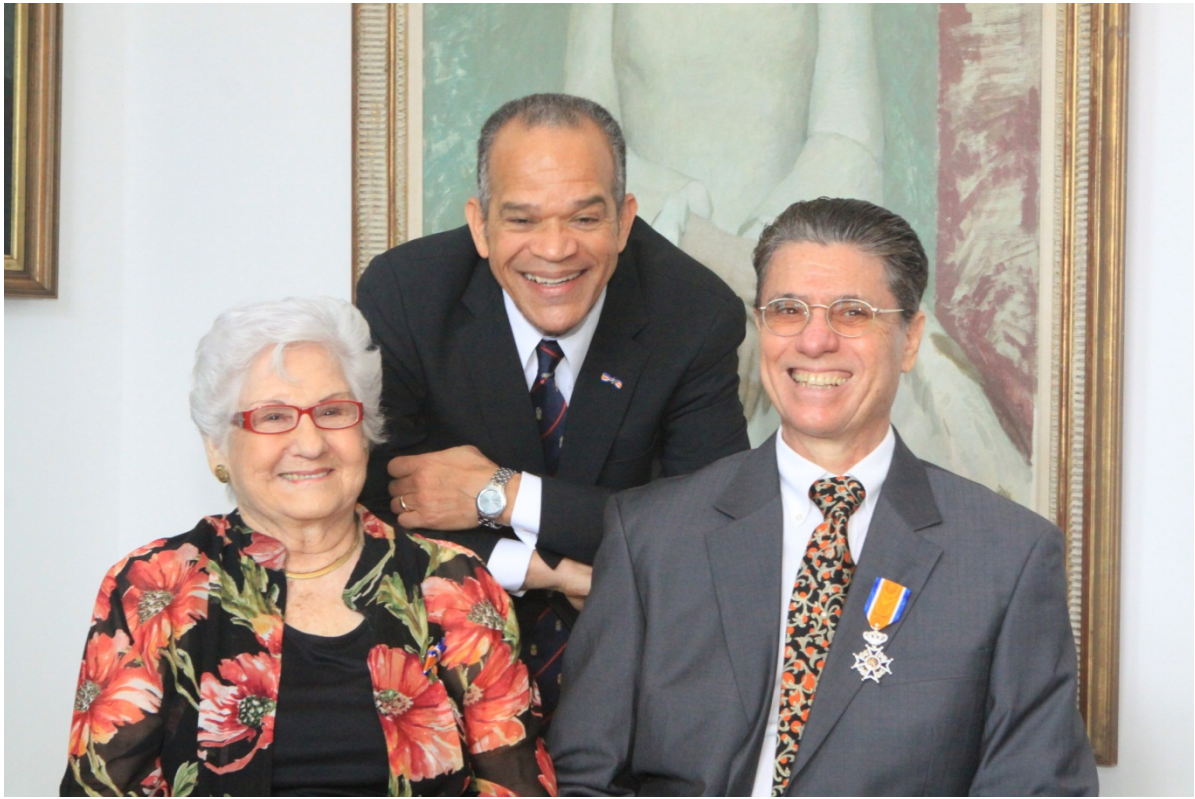
Uitreiking Lintjesregen 2012 – Curaçao