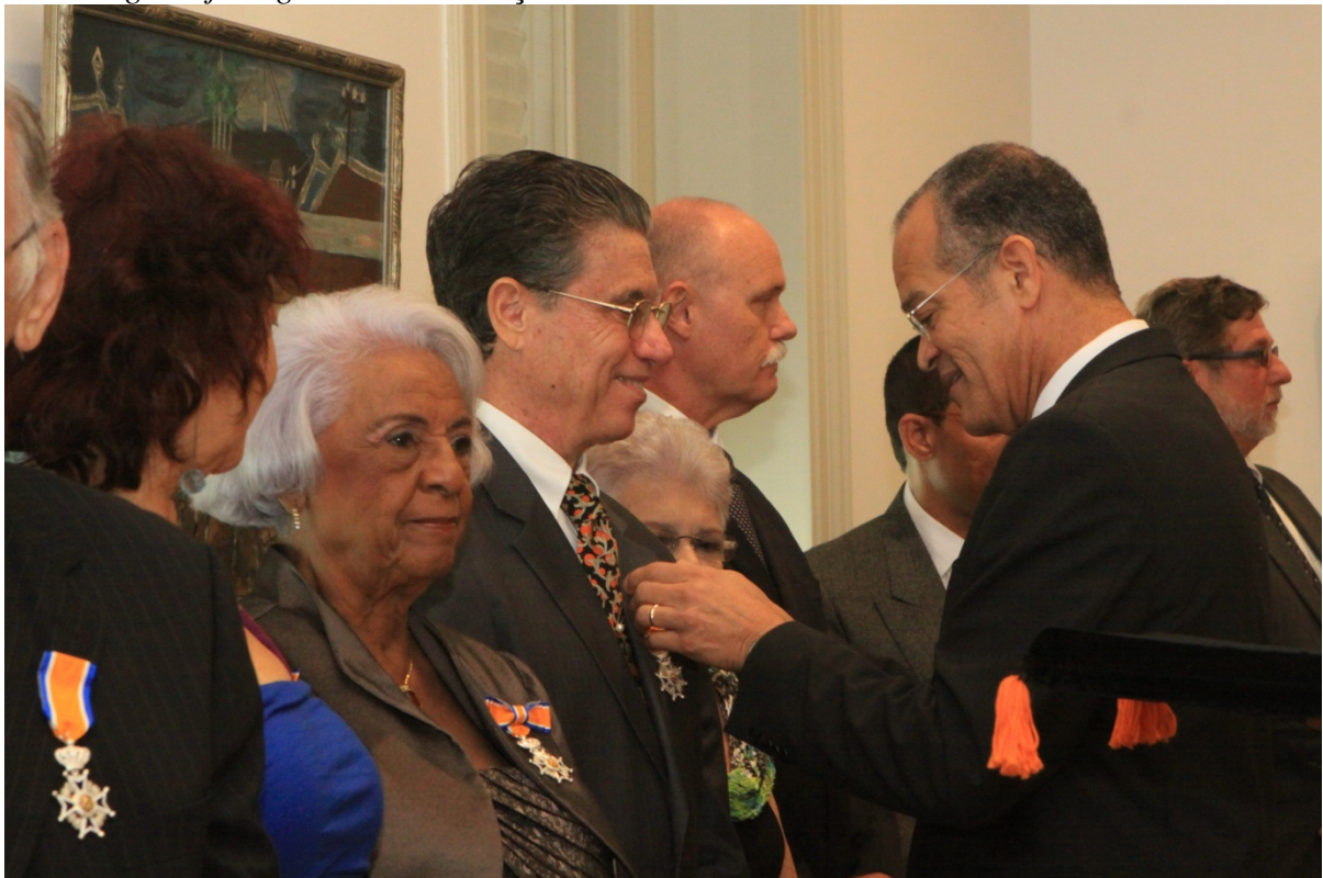
Uitreiking Lintjesregen 2012 – Curaçao