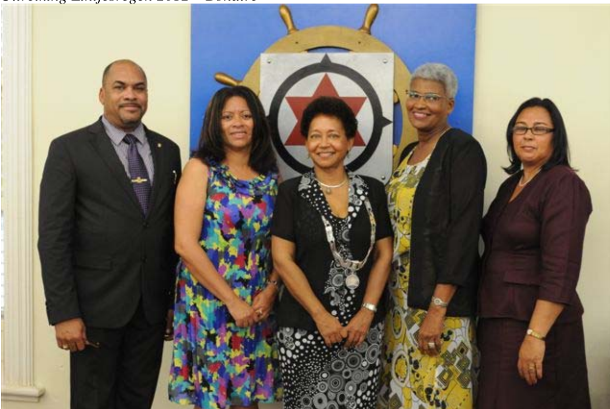
Uitreiking Lintjesregen 2012 – Bonaire