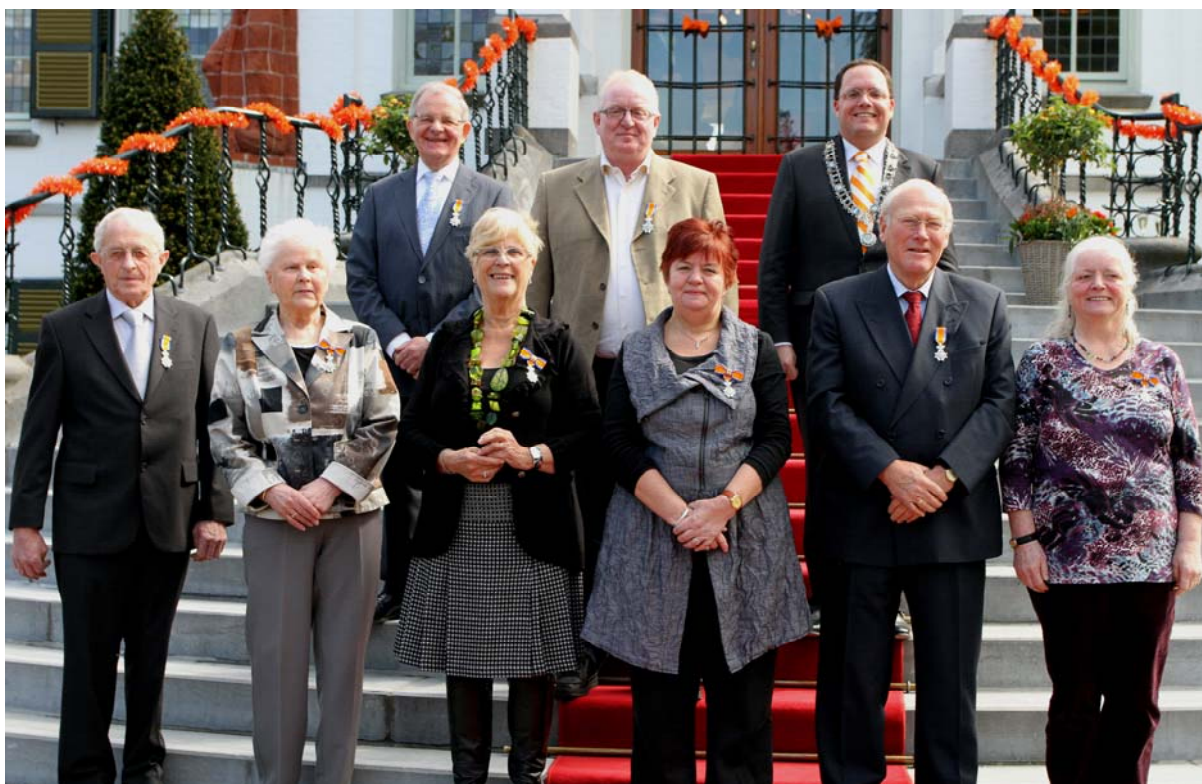
Uitreiking Lintjesregen 2012 - Gemeente Vught