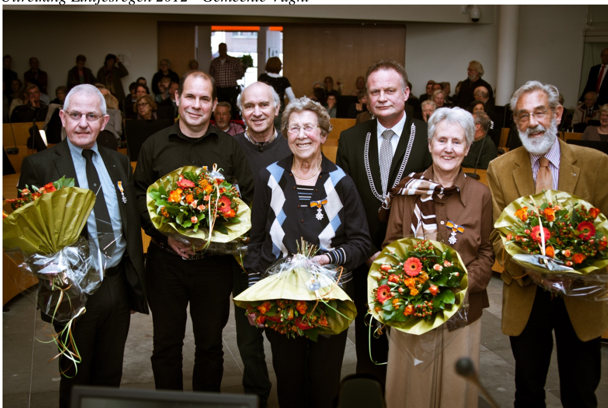
Uitreiking Lintjesregen 2012 – Gemeente Assen