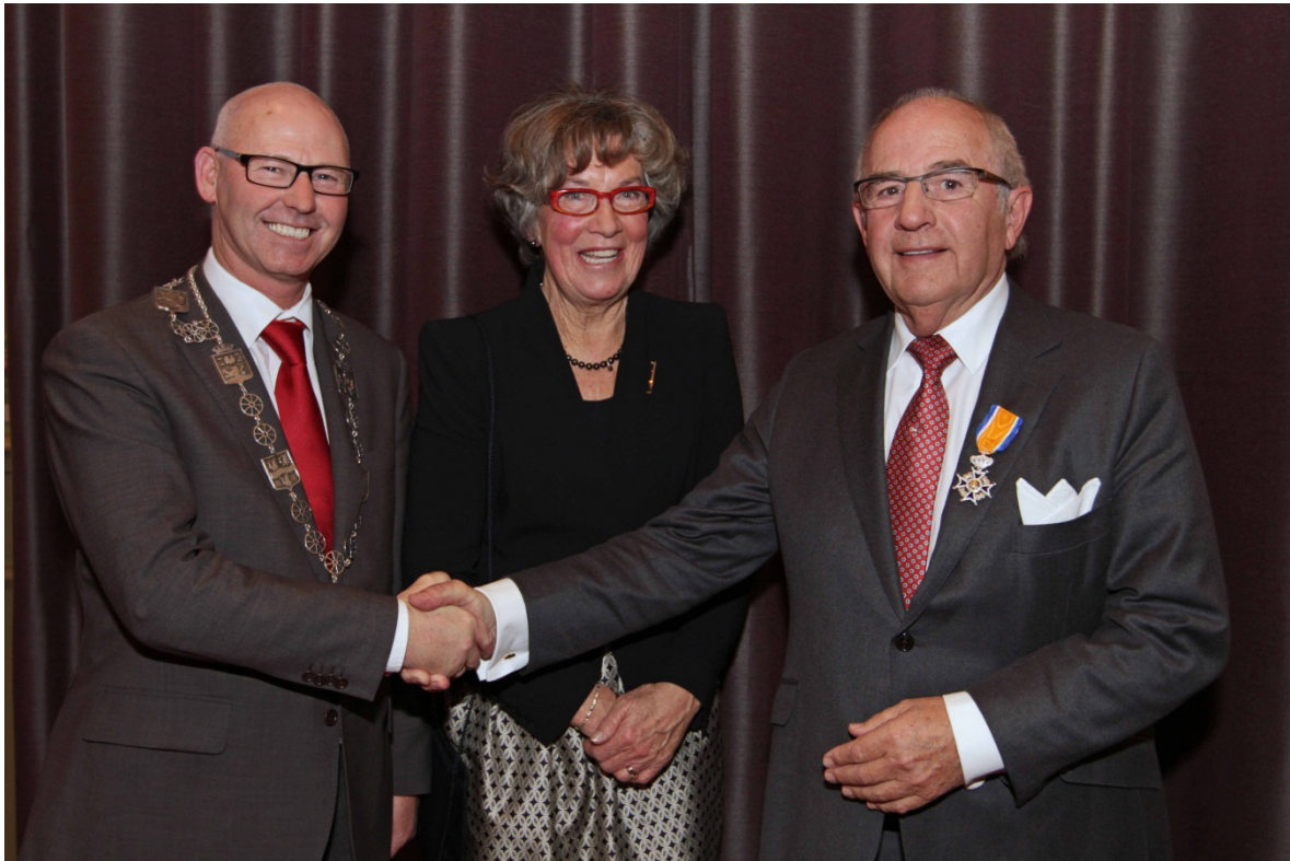
Uitreiking 2 februari 2012 – gemeente Kampen