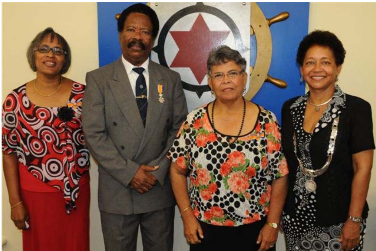
Uitreiking Lintjesregen 2012 – Bonaire