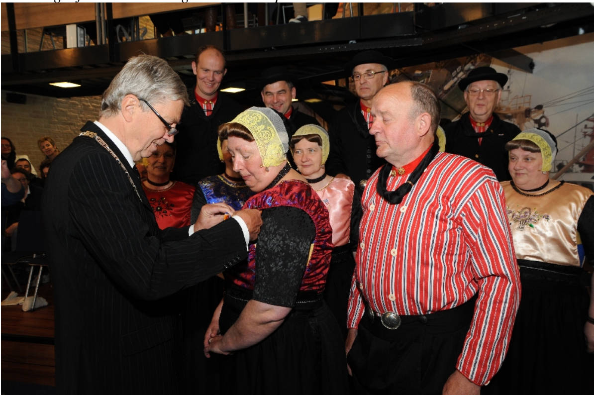
Uitreiking Lintjesregen 2012 – gemeente Urk