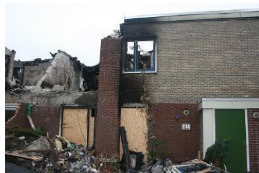
Foto's brand Hoofddorp

82 van de 102 woningcorporaties (80%) hebben gebouwen uit de risicocategorie in bezit en 20 woningcorporaties (20%) hebben dit niet.