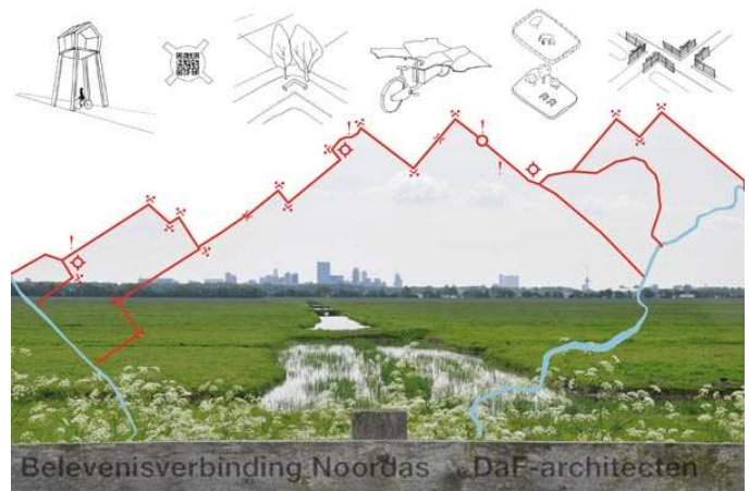
Het winnende idee van DaF- architecten

De ambitie is om de gehele Zuid- en Schiebroekse Polder integraal tot natuur- en recreatiegebied te ontwikkelen. Deze ambitie wordt ingegeven door het belang van het gebied op lokale en regionale schaal. Een integrale natuur- en recreatieontwikkeling voor de gehele Zuid- en Schiebroekse polder tezamen bestrijkt ongeveer 140ha. De PMR-opgave voor de Zuid- en Schiebroekse polder betreft de ontwikkeling van 100ha.