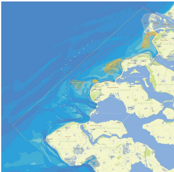
Figuur 2: Voordelta en het daarin gelegen bodembeschermingsgebied (binnen de rode contour) met rustgebieden (geel: jaarrond en geel gearceerd: alleen gedurende de winter)