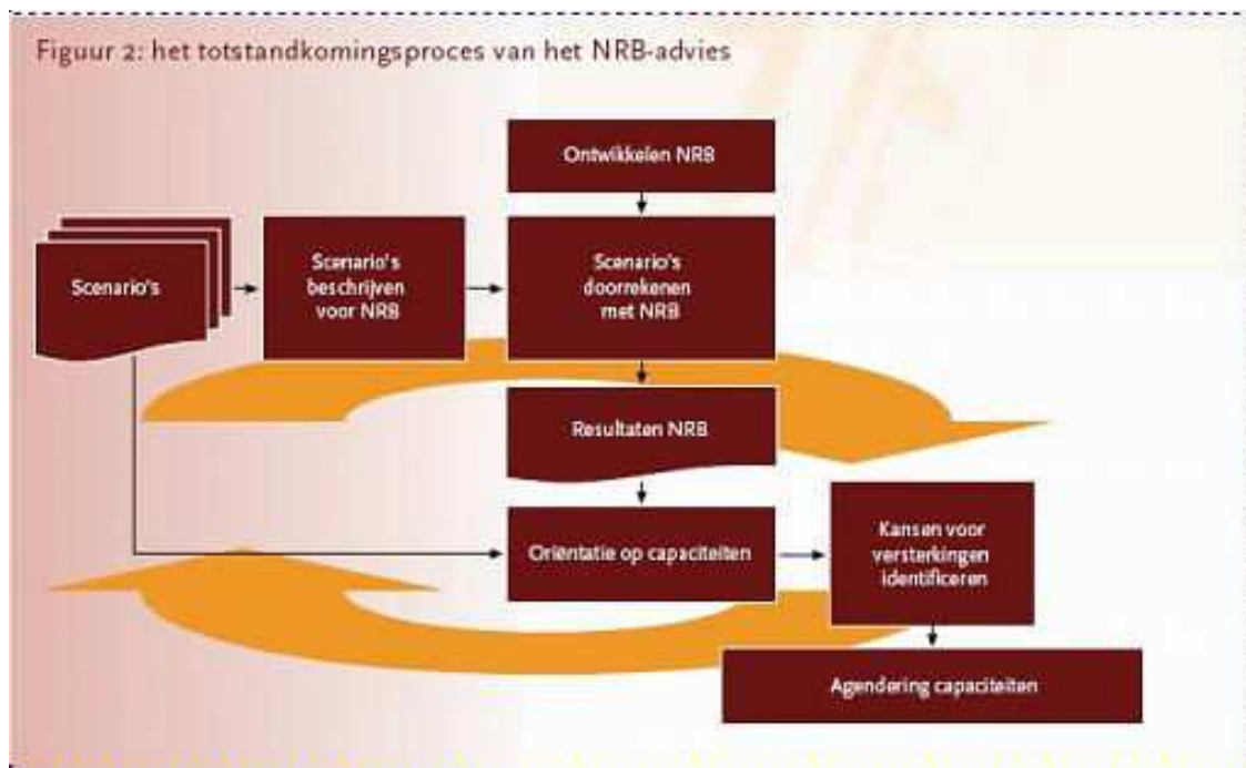
Figuur 3: het totstandkomingsproces van het NRB-advies

Een meer uitgebreide beschrijving van de methodiek staat in het document ' Werken met scenario's, risicobeoordeling en capaciteiten in de strategie Nationale Veiligheid ' van oktober 2009.