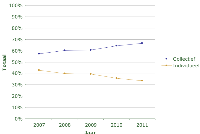
Figuur 2.1 Ontwikkeling percentage collectief en individueel verzekerden

Figuur 2.1 biedt inzicht in de ontwikkeling van het aantal collectief verzekerden ten opzichte van het aantal individueel verzekerden. Bij de invoering van de Zvw hebben veel verzekerden zich bij een collectief aangesloten. Sinds 2006 is het namelijk ook voor niet-werkgevers mogelijk om een collectief contract af te sluiten met een zorgverzekeraar. Daarna is de collectiviteitgraad op landelijk niveau jaarlijks met 2% gegroeid (van 2006 tot 2011 van 27.000 naar ruim 60.000 collectieve contracten). In 2011 is ruim 68% van de verzekerden collectief verzekerd. Inmiddels bestaan er allerlei soorten collectiviteiten die zich richten op specifieke en minder specifieke groepen zoals mensen in de bijstand, leden van een sportvereniging of een ouderenbond, maar ook rekeninghouders van de Rabobank. Veel collectiviteiten staan niet open voor alle individuele verzekerden, maar er zijn er wel die openstaan voor iedereen. Het is dus voor nagenoeg iedere individuele verzekerde mogelijk om zich aan te sluiten bij een collectiviteit 10 .