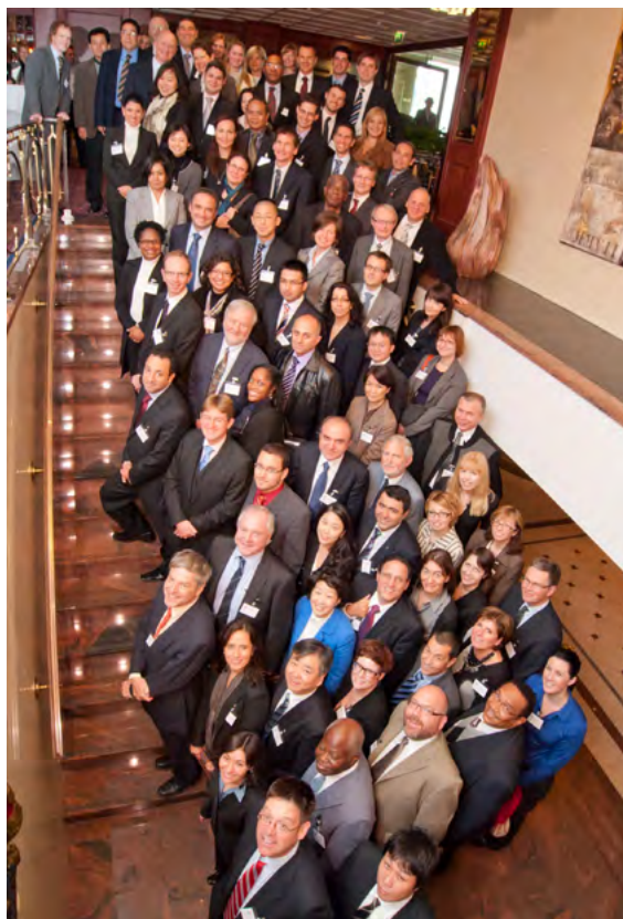
Afbeelding: Tweede internationale ICPEN-conferentie

De Consumentenautoriteit was van juli 2010 tot juli 2011 voorzitter van het International Consumer Protection and Enforcement Network (ICPEN). Het doel van ICPEN is het versterken van de internationale consumentenbescherming en daarmee de positie van de consument en de onderlinge uitwisseling van kennis. Daar waar consumenten en bedrijven zich in toenemende mate over de landsgrenzen begeven, neemt ook het aantal consumentenproblemen met een internationale dimensie toe. Dit vraagt in toenemende mate om samenwerking tussen nationale consumentenautoriteiten.