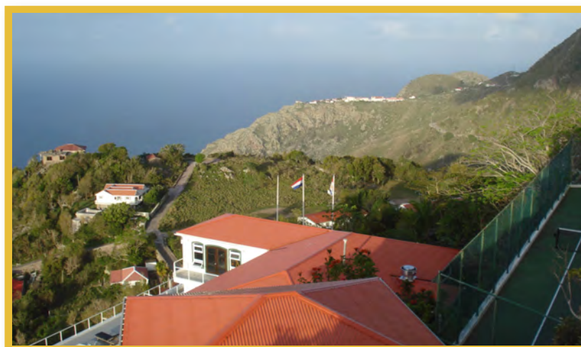
Afbeelding 15 Windward Side, Saba

Saba heeft noch een eigen depot noch labruimte om vondsten te verwerken en analyseren. Vondstmateriaal en documentatie zijn opgeslagen bij de Faculteit Archeologie van de Universiteit Leiden en NAAM. Een voorstel van een Nederlandse consultant (2001) voor een ondergronds, orkaan bestendig depot is beschikbaar, maar financieel onhaalbaar. NAAM kwam met een bescheidener voorstel voor een bestaande ruimte, maar dat is tot op heden niet van de grond gekomen.