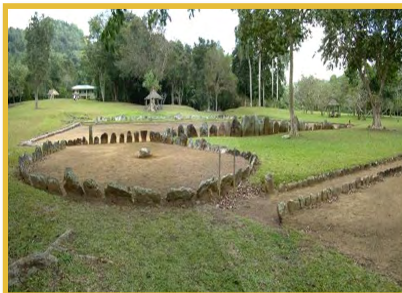
Afbeelding 8 Batey de Utuado, Caguana, Puerto Rico