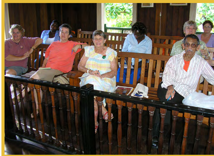
Afbeelding 9 Leden van de St. Eustatius Historical Foundation

Monumenteneilandsverordening ontwikkeld.