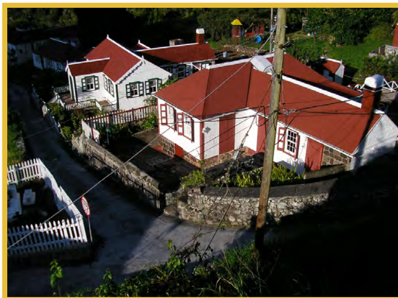
Afbeelding 4 The Bottom, Saba

Van belang is verder dat artikel 13 van deze Eilandsverordening de onderhoudsplicht van de eigenaar van een beschermd monument expliciet uitbreidt tot 'daartoe behorende muren of erfafscheidingen'. De Monumenteneilandsverordening van Sint Eustatius kent een overeenkomstige bepaling (artikel 12). Voor het overige zie paragraaf 2.2.1 (Sint Eustatius).