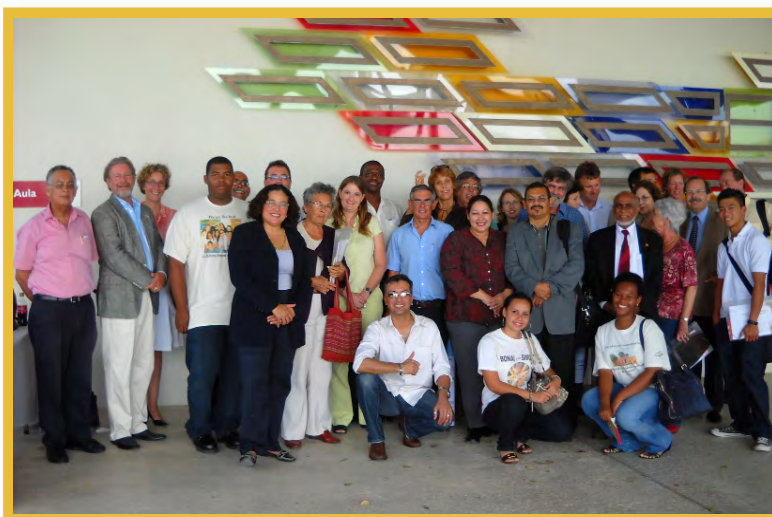
Afbeelding 16 Deelnemers Seminar Cultural Heritage Legislation in Caribbean Perspective 2009, Curaçao

Om andere eilanden te stimuleren Malta te implementeren en praktijkkennis uit te wisselen, heeft NAAM in 2005 en 2009 een seminar gehouden waar de Nederlands Caribische en enkele andere Caribische landen, zoals Puerto Rico en Trinidad & Tobago, vertegenwoordigd waren. De seminars waren een groot succes, niet in de laatste plaats omdat 'eiland' zijn bepaalde overeenkomsten in de uitvoering van archeologiebeleid met zich mee brengt. In de toekomst zal dit zeker een vervolg krijgen.