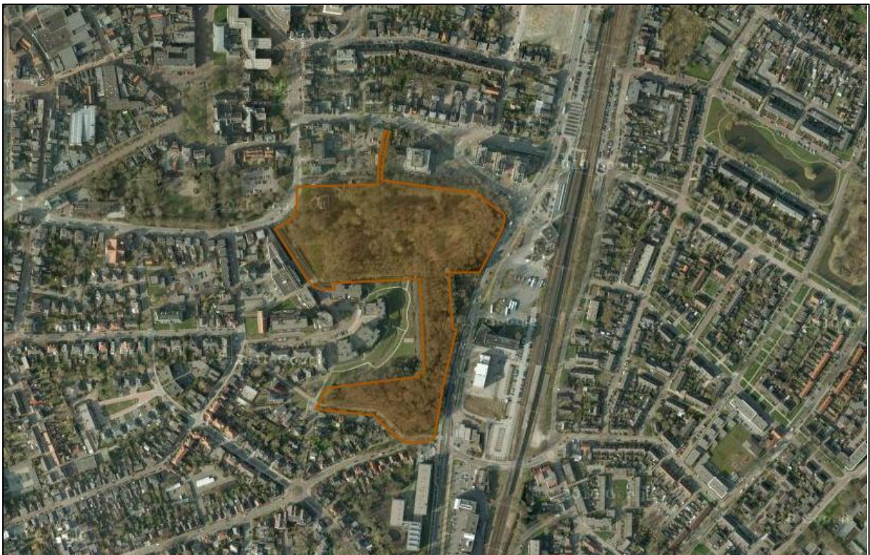
Figuur 2: Ligging Beschermd natuurmonument Overcingel in de stad Assen.