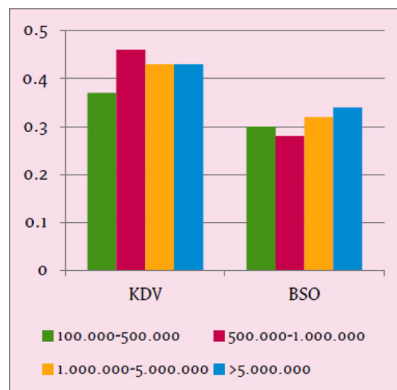
Figuur 3: FTE/kind per omzetklasse (2008)