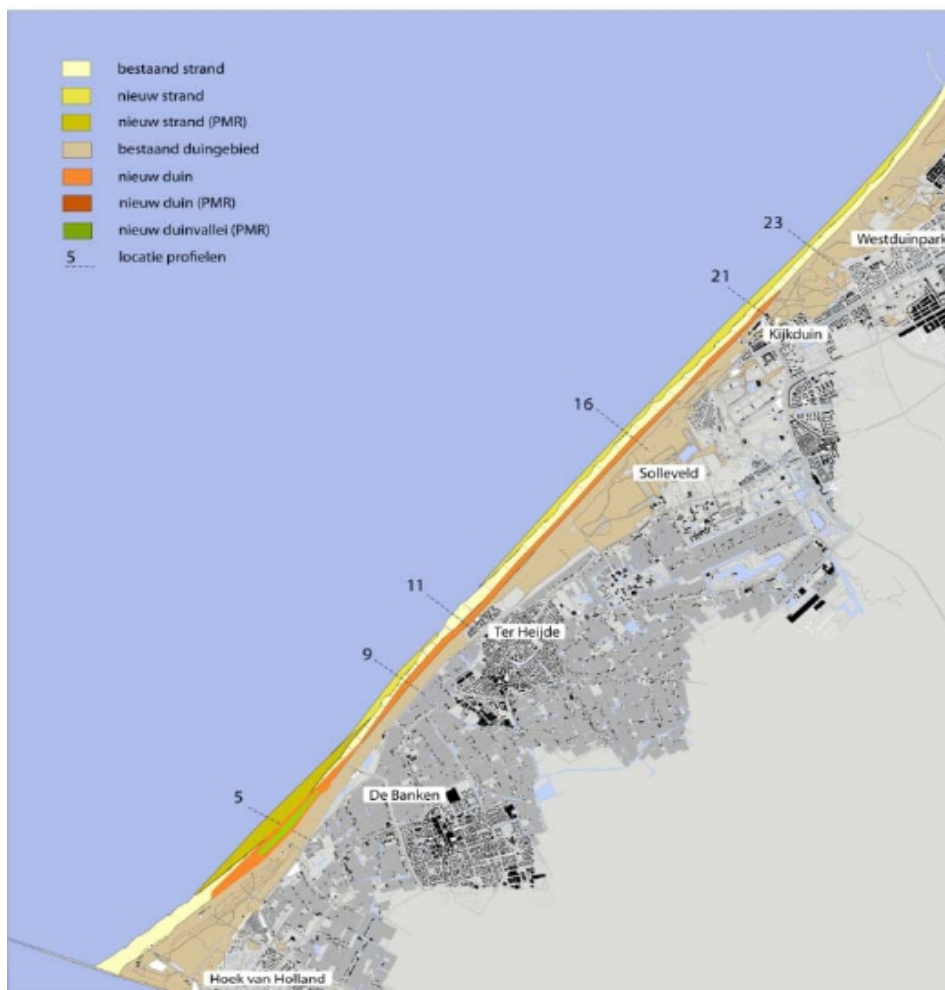
Figuur 1: Locatie duincompensatie Delflandse Kust en zwakke schakel Delfland.

Onderstaande figuur 1 laat de locatie zien waar de duincompensatie in combinatie met de versterking van de zwakke schakel Delfland zijn aangelegd.