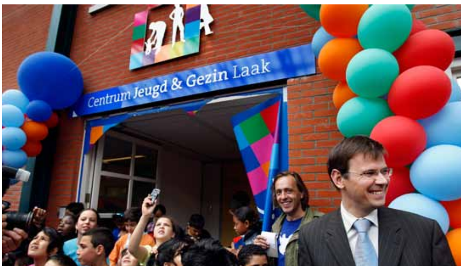
André Rouvoet opende op 25 juni 2008 het Centrum Jeugd en Gezin Laak. Het Centrum in de wijk Laak is het eerste dat geopend is in Den Haag.