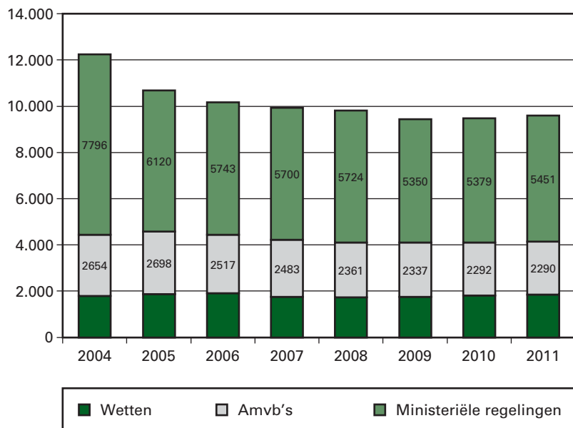
Figuur: Aantal geldende wetten, AmvB's en ministeriële regelingen per 1 januari 2004–2011

Vanaf 2004 tot 2010 is het aantal geldende wetten, AMvB's en ministeriële regelingen gedaald, maar in 2011 was sprake van een lichte stijging van het aantal wetten, AMvB's en ministeriële regelingen ten opzichte van 2010. Belangrijke reden hiervoor is de extra regelgeving die nodig was voor het ingaan van de nieuwe staatkundige structuur van het Koninkrijk der Nederlanden per 10 oktober 2010.