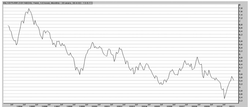
Grafiek 2. Ontwikkeling 10-jaarsrente in percentages (rechteras) tussen 1993 en 2011.