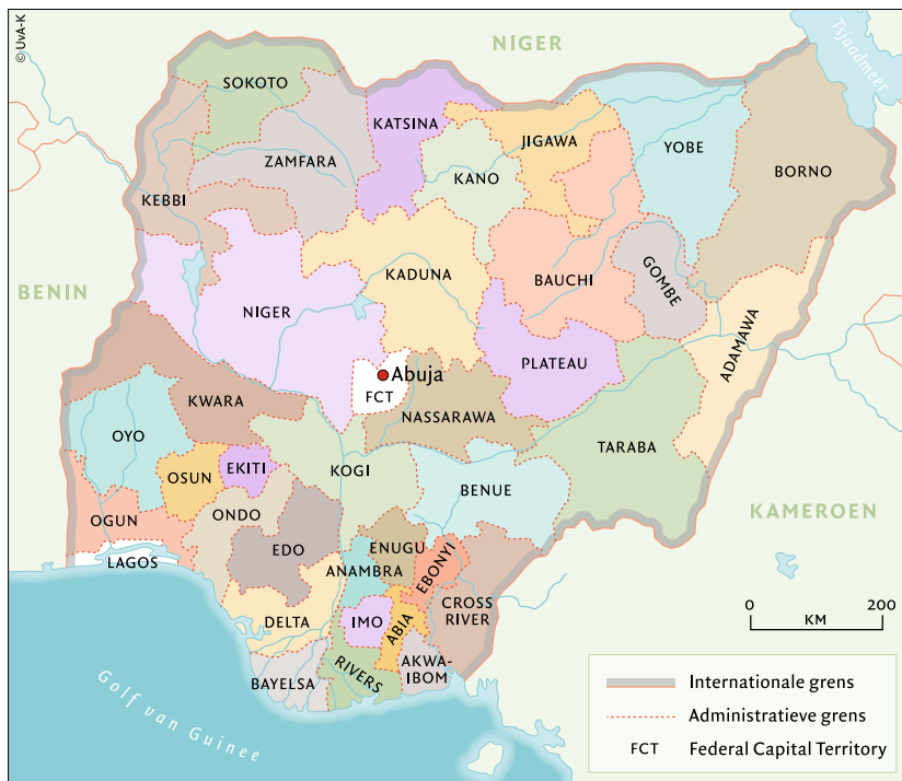
Kaart 2 De 36 deelstaten van de federale republiek Nigeria

In 2007 werd Alhaji Umaru Yar'Adua president. Toen hij in 2010 met ernstige gezondheidsproblemen werd overgebracht naar een ziekenhuis in Saoedi-Arabië, werd de macht aanvankelijk niet overgedragen. Bovendien deed de regering nauwelijks mededelingen over zijn toestand. Dit werkte verlammend voor het bestuur en de politiek. Umaru Yar'Adua overleed in mei 2010. Hij werd opgevolgd door vice-president Goodluck Jonathan.