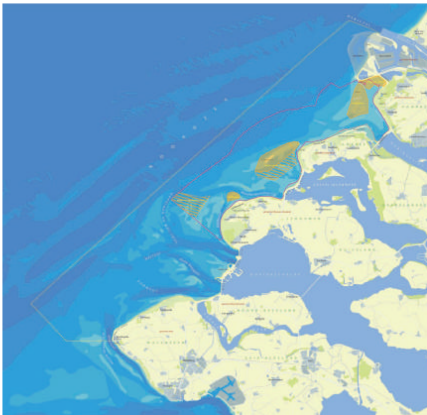
Figuur 2: Voordelta en het daarin gelegen bodembeschermingsgebied (binnen de rode contour) met rustgebieden (gele zones)

Onderstaande figuur 2 laat zien waar het bodembeschermingsgebied met de bijbehorende rustgebieden is gelegen in de Voordelta.