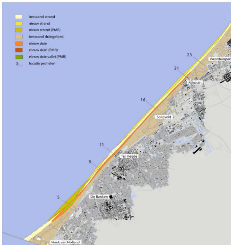
Figuur 1: Locatie duincompensatie Delflandse Kust en zwakke schakel Delfland.

Onderstaande figuur 1 laat de locatie zien waar de duincompensatie in combinatie met de versterking van de zwakke schakel Delfland zijn aangelegd.