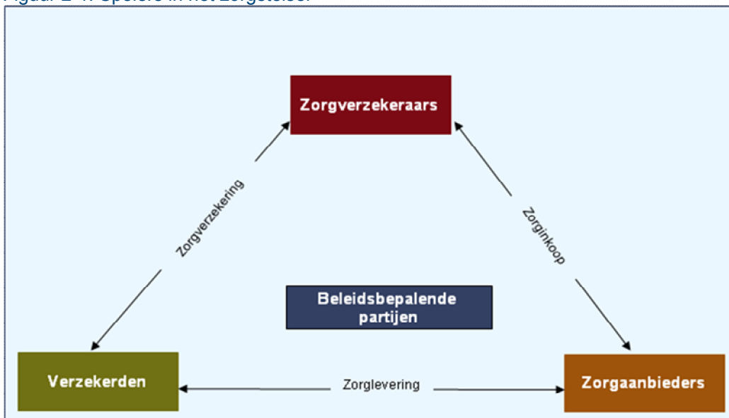
Figuur 2-1: Spelers in het zorgstelsel