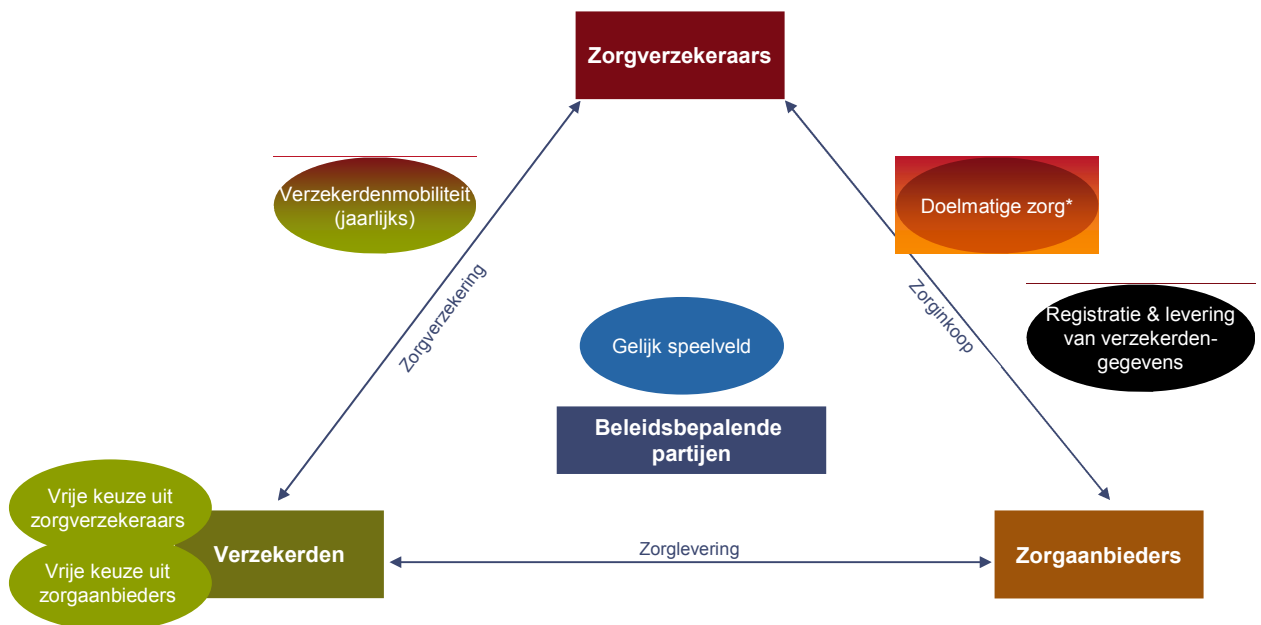
Figuur 2-3: Kenmerken zorgstelsel cruciaal voor vormgeving risicoverevening