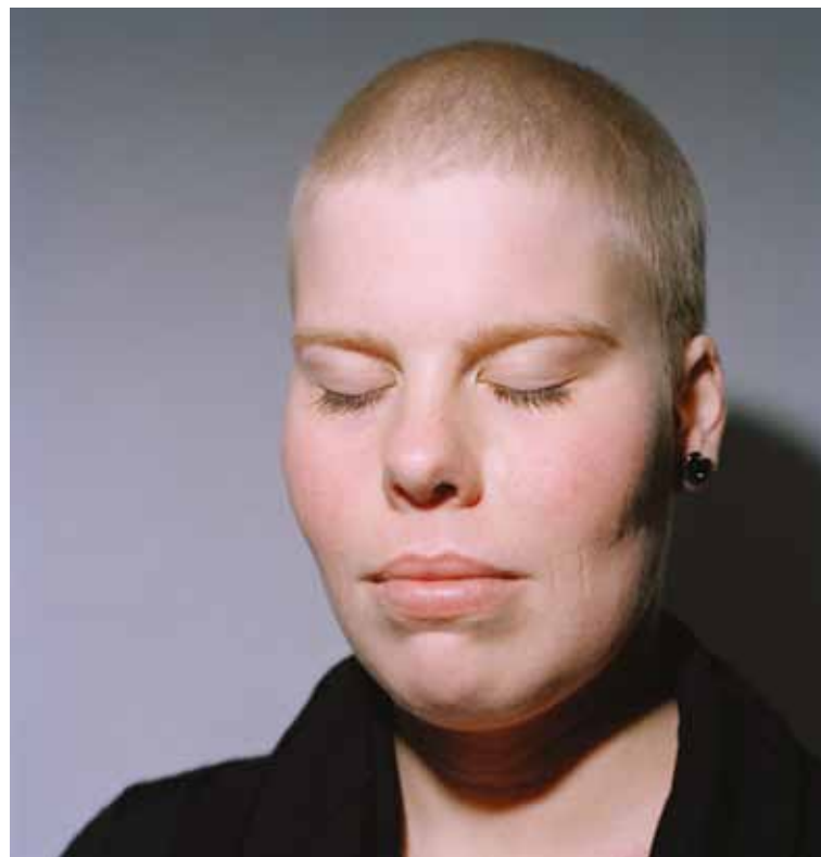
Ik ben in de zevende hemel, ook omdat mijn haren en wenkbrauwen terugkomen. Je realiseert je: ik ga weer leven. 7 december 2006