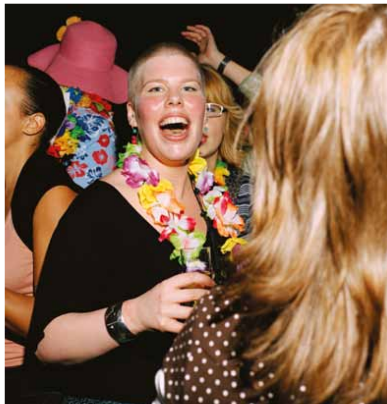
Ik ben zo opgelucht. Sta hier tussen vrienden en familie op mijn feest, '25 jaar en gezond'. Er heerst een ongelooflijke energie. Iedereen is uitgelaten: we zijn erdoorheen! 9 december 2006