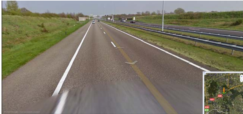
Figuur 2 Ruimteprofiel A58 knooppunt Galder - knooppunt Sint Annabosch

Bij de uitwerking van de voorkeursoplossing zijn een aantal aandachtspunten: