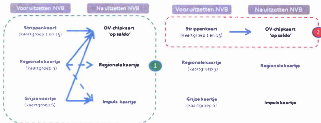
Figuur 1: Groepen reizigers beschouwd in analyse kostenneutraliteit voor de provincie Fryslân

In de volgende figuur 1 is dit weergegeven: niveau 1 betreft de analyse voor het totaal (exclusief abonnementen), niveau 2 betreft de analyse voor reizigers die gebruik maken van de strippenkaart (blauw en roze).