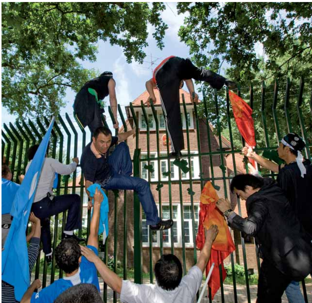
Op 6 juli 2009 werd gedemonstreerd bij de Chinese ambassade in Den Haag naar aanleiding van de situatie in de Chinese provincie Xinjiang. Na een half uur liepen de hevige emoties uit in spreekkoren en er werden stenen richting de ambassade gegooid. Uiteindelijk besloot het OM Den Haag lik-op-stukbeleid toe te passen en verdachten door middel van supersnelrecht voor de rechter te brengen.