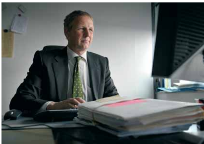
Hoofdofficier van het parket Alkmaar Jeroen Steenbrink.

Wat is nieuw in de wet VPS? Steenbrink: "Beleid en wetgeving om slachtoffers via een strafproces te ondersteunen waren er al. Maar de uitvoering door politie en OM was niet altijd even eenvoudig. Met de nieuwe wet krijgen slachtoffers veel beter en sneller wat hen toekomt. Ze bevat onder meer de voorschotregeling, waarbij de staat in ernstige zaken schadevergoeding voorschiet aan het slachtoffer zodat