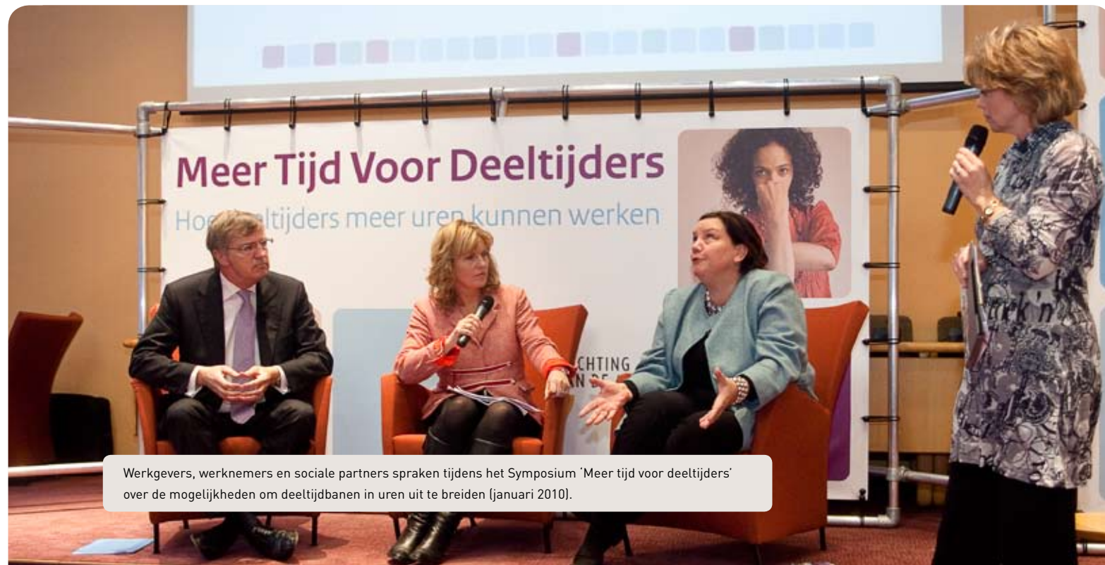
Werkgevers, werknemers en sociale partners spraken tijdens het Symposium 'Meer tijd voor deeltijders' over de mogelijkheden om deeltijdbanen in uren uit te breiden (januari 2010).