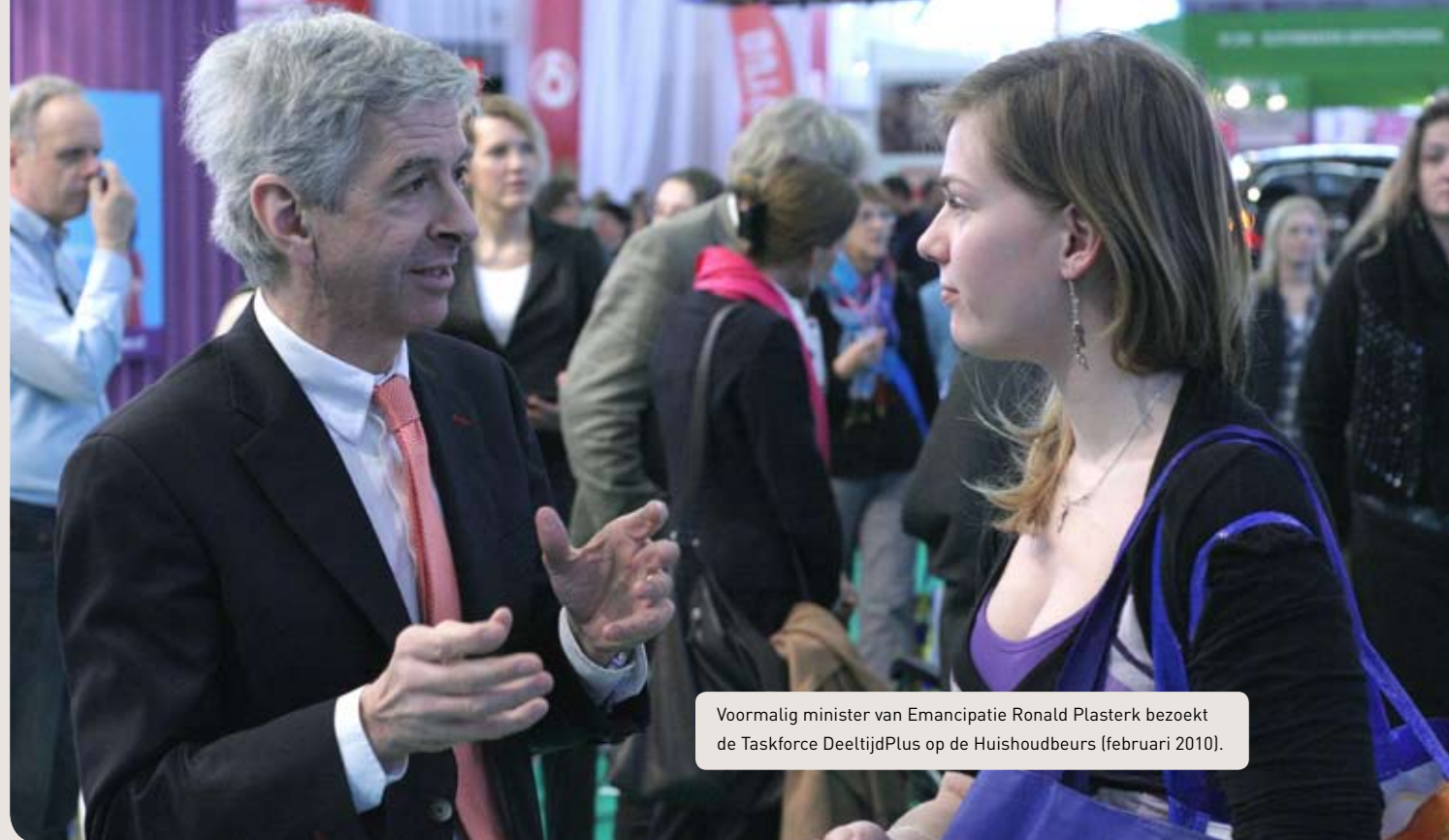
Voormalig minister van Emancipatie Ronald Plasterk bezoekt de Taskforce DeeltijdPlus op de Huishoudbeurs (februari 2010).

ze meer uren gaan werken. De combinatie van steekhoudende argumenten en feiten en cijfers leidt tot gefundeerde keuzes rondom meer uren werk.