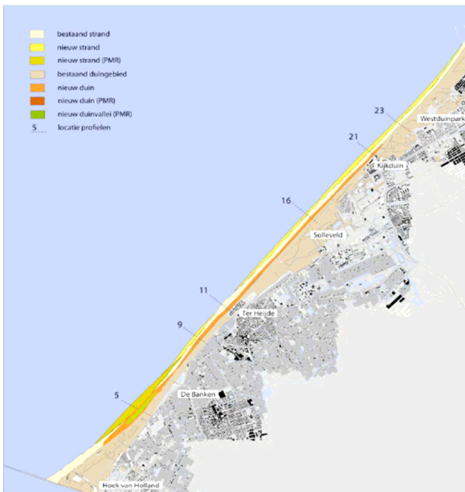
Figuur 1: locatie duincompensatie Duinen van Delfland en zwakke schakel Delfland.

Onderstaande figuur 1 laat de locatie zien waar de duincompensatie in combinatie met de versterking van de zwakke schakel Delfland wordt aangelegd.