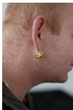
"Die oorbellen zijn om de begrafenis te betalen als je overboord slaat"