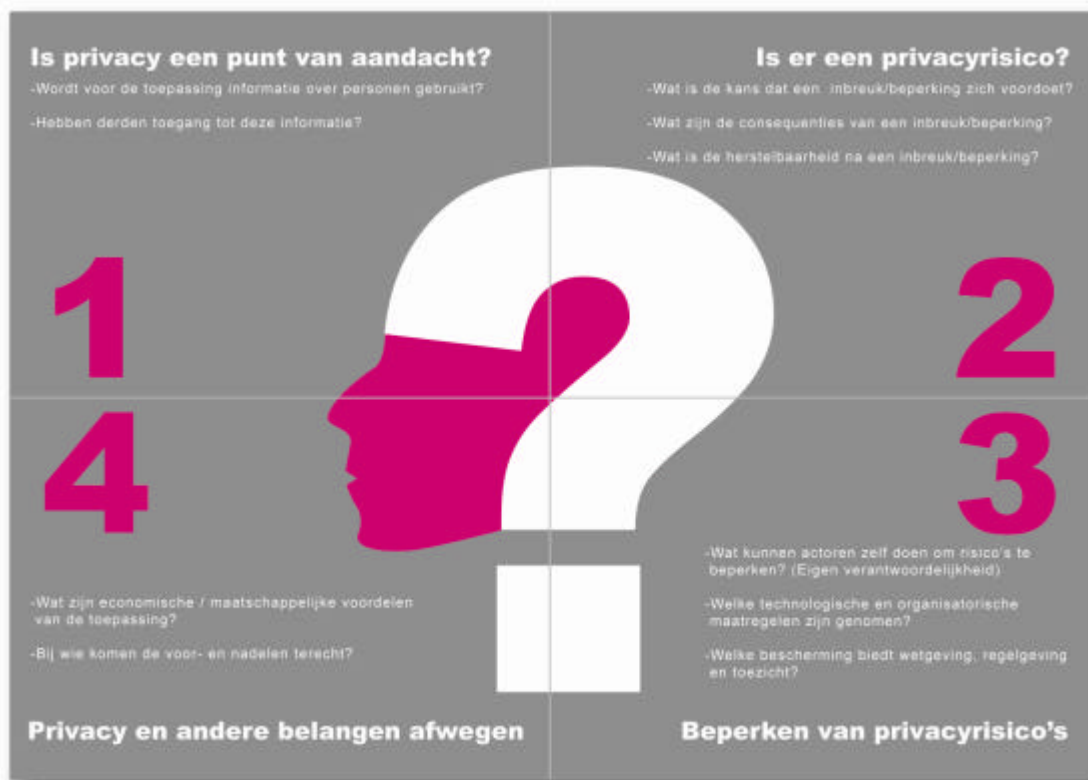
Figuur 3: Het 'privacy-vierkant', een model voor communicatie over privacy

Vanuit hun coördinerende rol op het terrein van ICT en privacy zullen de ministeries van Economische Zaken, Justitie en Binnenlandse Zaken en Koninkrijksrelaties de komende tijd nadrukkelijker aandacht vragen voor dit aspect en waar mogelijk adviseren over het aanpakken ervan.