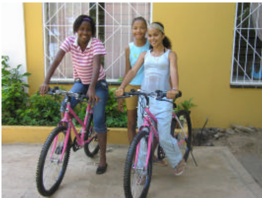
Jongeren Huize St. Jozef met nieuwe fietsen