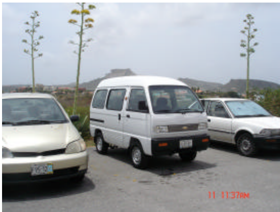
Nieuw busje Kinderorden Brakkeput

Een andere aanpassing is ook dat het tehuis aanvankelijk een bus zou aanschaffen waarin 15 personen kunnen worden vervoerd. Uiteindelijk hebben zij uit praktisch oogpunt twee bussen aangeschaft die zitplaatsen bieden voor 8 personen. De reden hiervoor is dat het besturen van een bus van 15 passagiers een groot rijbewijs vereist. Dit leidt tot beperkingen voor de inzet van mankracht als de chauffeurs met een groot rijbewijs niet beschikbaar zijn. Door het aanschaffen van de kleinere bussen kunnen de medewerkers ingezet worden om de bussen te besturen. De aanschaf van de twee bussen heeft geen consequenties gehad voor het budget.