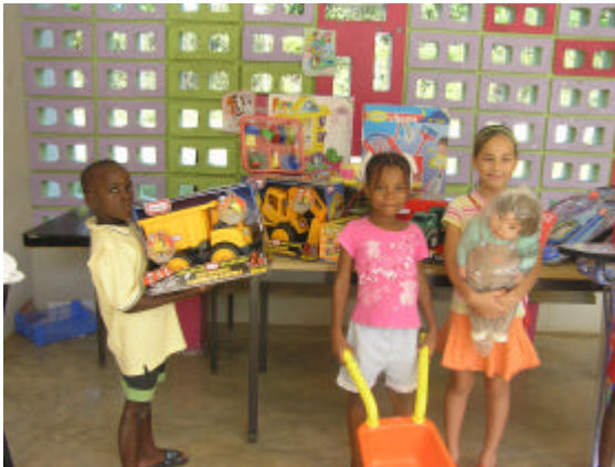
Kinderen Huize St. Jozef met nieuw speelgoed

De toekenning van het geld is voornamelijk besteed aan het opknappen van het gebouw en de brandbeveiliging (65.7%). Hiernaast is met 15.9% van de middelen de buitenspeelplaats opgeknapt.