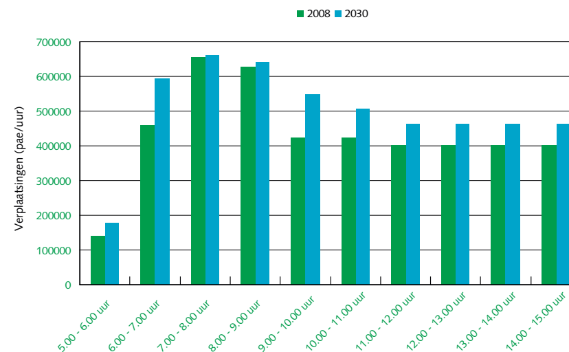
Figuur 1: Verplaatsingen per uur in de Randstad in 2030 (vrachtwagens en personenauto's)

In figuur 1 is het aantal vrachtwagen- en autoverplaatsingen per uur weergegeven in de Randstad in 2008 en 2030. Tussen 5.00-15.00 uur worden in 2030 in totaal 5,0 miljoen verplaatsingen gemaakt. Dit is 15 procent meer dan in 2008 10 . De groei vindt met name voor en na de ochtendspits plaats.