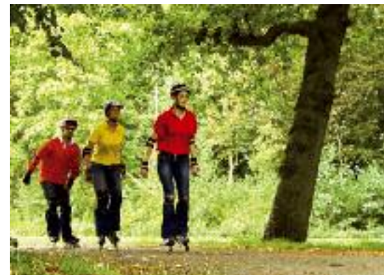
In 2008. Van de terreinen was 92% opengesteld voor het publiek. Deze score is hoger dan de taakstelling van