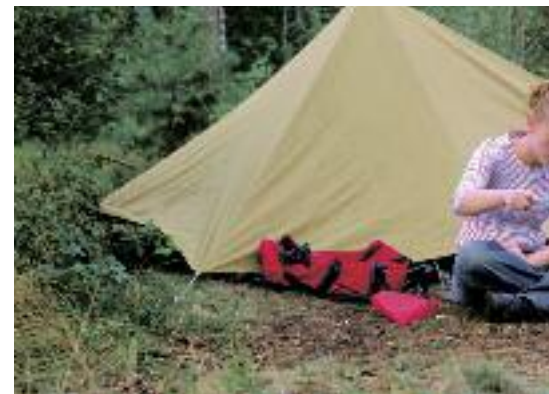
In 2008. Aantal Natuurkampeertreinen: 42. Aantal