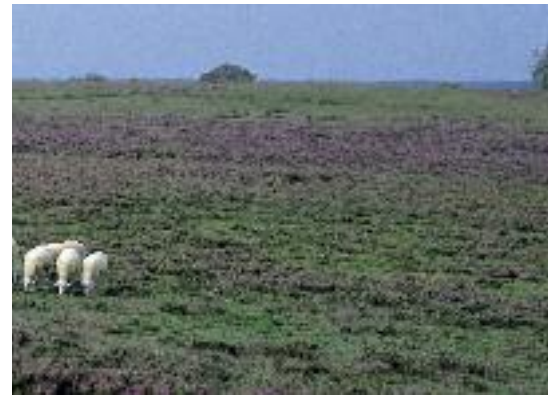
In 2008 heeft Staatsbosbeheer in twaalf gebieden