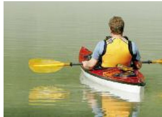
In 2008. Totale bedrijfsopbrengsten: 140.915.000 euro. Omzet recreatie: 4.102.000 euro. Omzet houtverkoop: 17.867.000 euro.