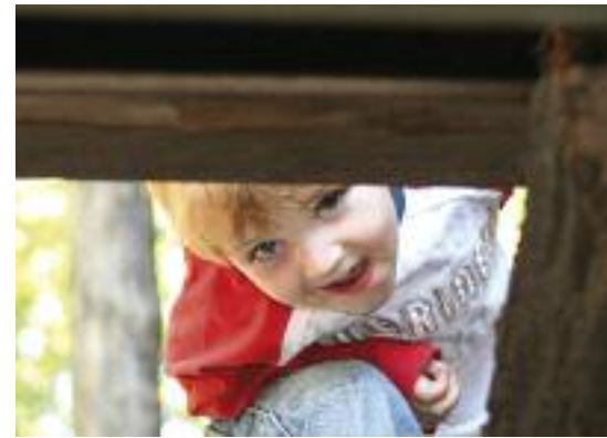
In 2008. Aantal bezoekende kinderen (tot 18 jaar): 210.000. In speelzones: 135.000 kinderen. Begeleide activiteiten: 75.000 kinderen.