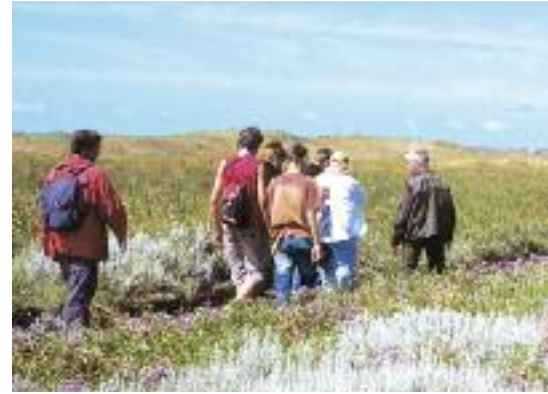
In 2008. Omzet excursies, rondleidingen, verkopen en overige omzet recreatie: 1.231.000 euro. Totaal