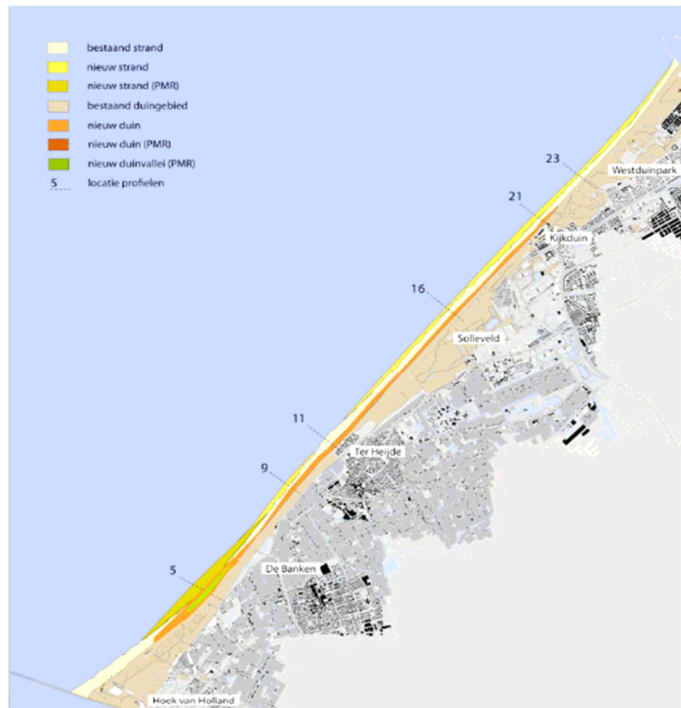
Figuur 1: locatie duincompensatie en zwakke schakel Delfland.

Onderstaande figuur 1 laat de locatie zien waar de duincompensatie in combinatie met de versterking van de zwakke schakel Delfland wordt aangelegd.