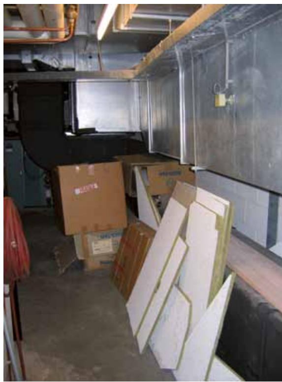
Opslag brandbare materialen in stookruimte

Bij vijf bureau's werden in strijd met de voorschriften brandbare goederen in de stookruimte aangetroffen.