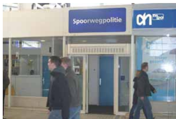
Bureau van de Spoorwegpolitie/KLPD te Utrecht

De bureau's van de Spoorwegpolitie/KLPD zijn niet in eigendom bij het korps. Meestal zijn ze in eigendom bij (een onderdeel van) de Nederlandse Spoorwegen. De bureau's worden gehuurd en beheerd door de Rijksgebouwendienst. In één geval (Arnhem) is het kantoorpand waarin het politiebureau is gevestigd ook eigendom van de Rijksgebouwendienst.