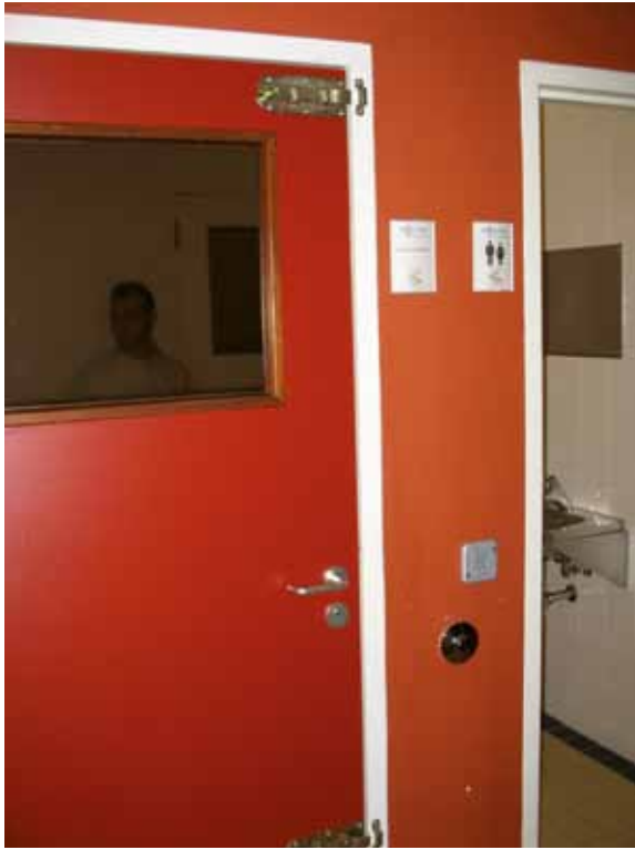
Celdeur met een slot en twee grendels

Op geen van de vijf onderzochte locaties zijn obstakels in de vluchtwegen aangetroffen en overal werkten (voor zover aanwezig) zelfsluitende brand- en rookwerende deuren naar behoren.