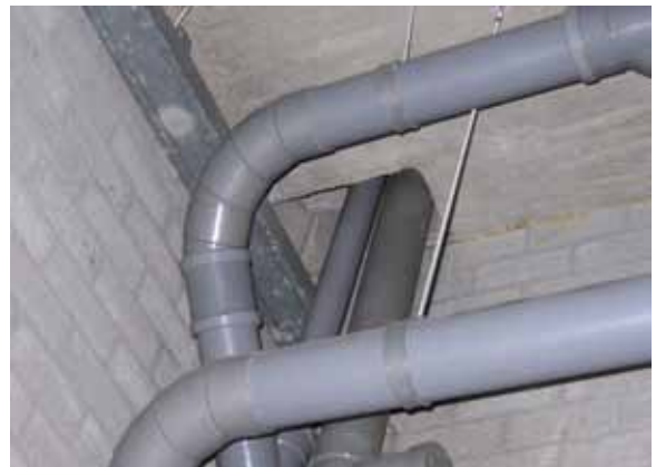
Niet brandwerend afgewerkte doorvoer naar cellencomplex

De geconstateerde gebreken ten aanzien van de subbrandcompartimentering van de cellen deden zich zowel voor bij ophoudruimten in kleinere politiebureau's als in de grotere bureau's met cellencomplexen.