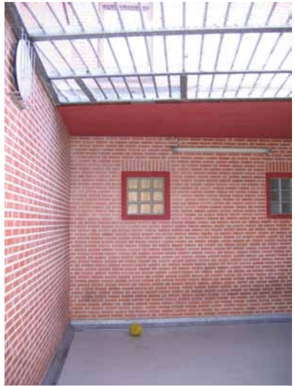
Luchtplaats met ontsnappingsluik

In politiebureau's waar tekortkomingen met de brandcom- partimentering zijn geconstateerd, was de rookcomparti- mentering meestal ook niet op orde.