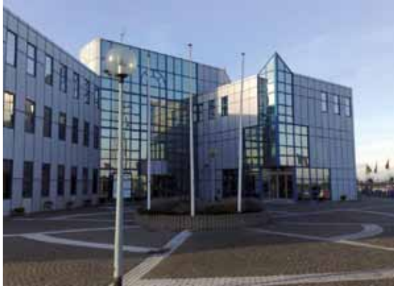
Pand op Rotterdam Airport waarin de Marechaussee is gehuisvest.

De bureau's in Rotterdam en Haarlemmermeer zijn eigendom van de Luchthaven Schiphol. Het bureau in Eindhoven is in eigendom bij het Ministerie van Defensie.