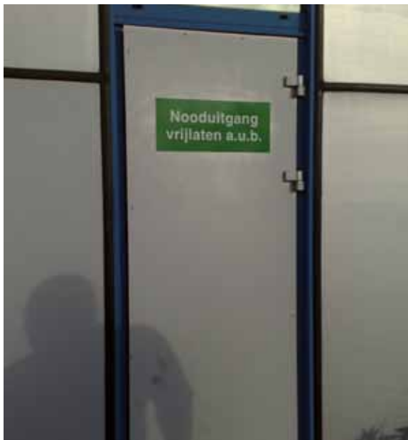
Van opschrift voorziene nooduitgang

Op alle locaties waren de vluchtdeuren aan de buitenzijde voorzien van het verplichte opschrift.