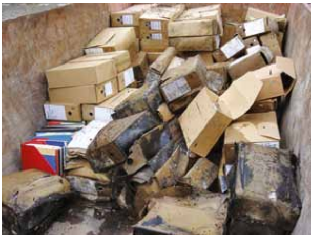
Brand Technische Universiteit Delft

De archiefruimte voldeed niet aan alle archiefwettelijke eisen. Er was geen calamiteitenplan voor de archieven opgesteld. Men beschikte niet over een volledig en betrouwbaar bestandsoverzicht van de aanwezige archieven. De universiteit brengt in kaart welke archiefdelen de brand hebben doorstaan en hoe deze hersteld kunnen worden. De Erfgoedinspectie ziet erop toe dat adequate maatregelen worden getroffen.