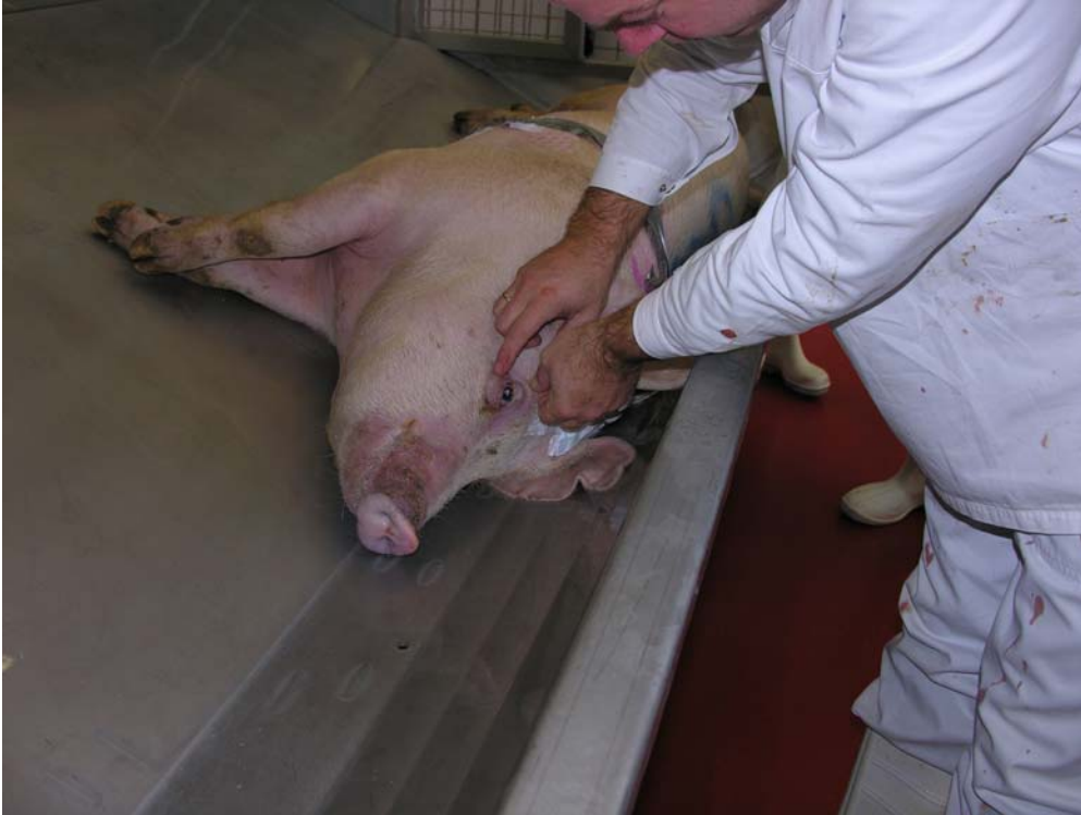
Figuur 5. Controleren op bewustzijn