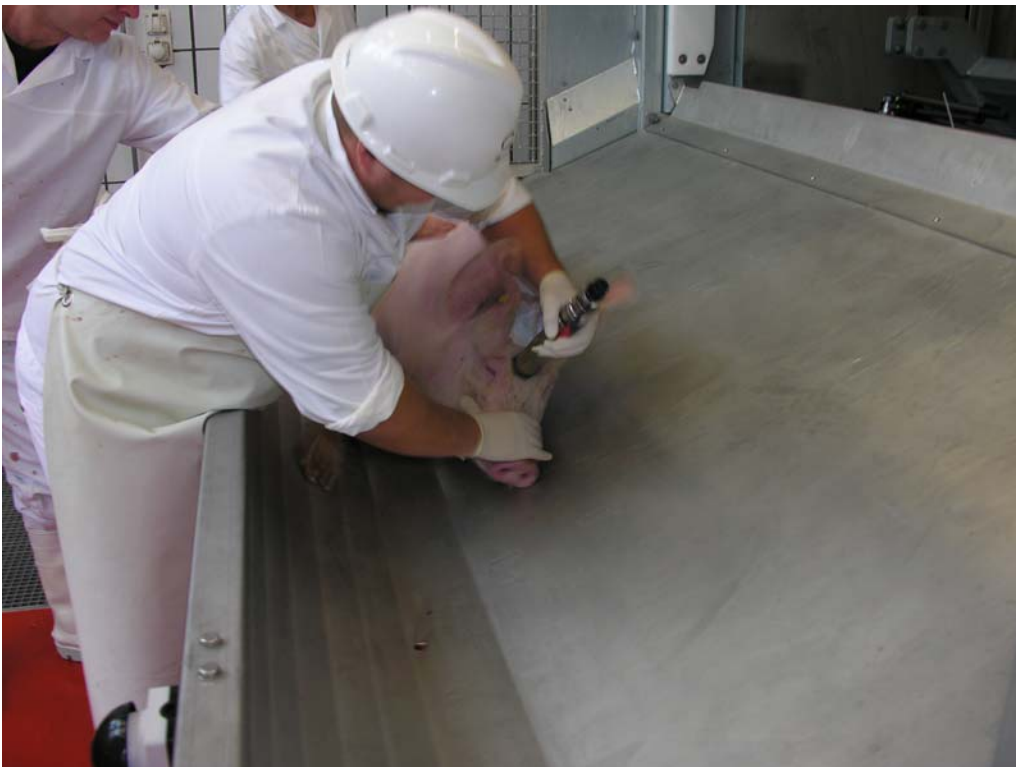
Figuur 6. Schieten van de varkens met schietmasker