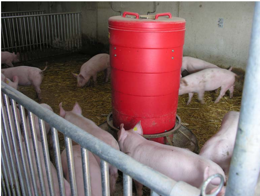
Figuur 2. De proefvarkens tijdens de opfok