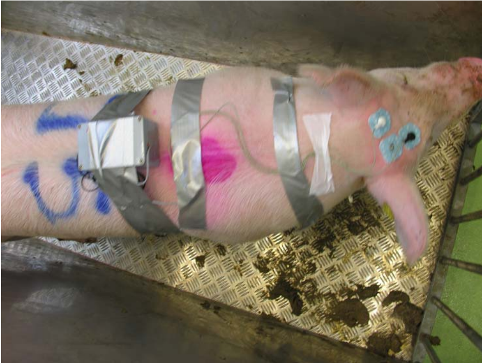
Figuur 3. Varken met EEG en ECG meter aangesloten