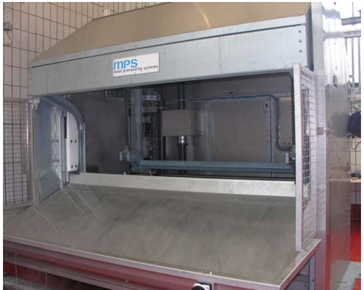
Figuur 1. Gasverdover geschikt voor 2 varkens