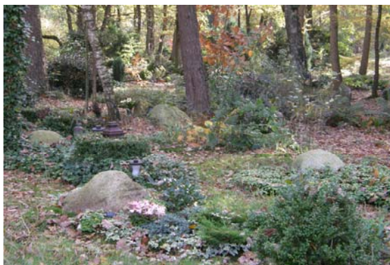
Figuur 2. Impressie natuur-begraafplaats Westerwolde (foto's: J.G. de Molenaar).

Er is dus sprake van een aanzienlijke spreiding in de mate van verstoring door het begraven c.a. en in het natuurlijk karakter van de begraafplaats.