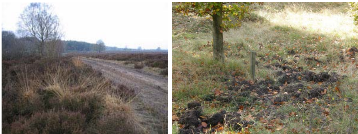
Figuur 4. Nationaal Verstrooiterrein Delhuizen. Links: landschapsbeeld. Rechts: strooiplek bij adoptieboom met markeringspaaltje.

De as mag ook worden verstrooid op een zelf bepaald dierbaar plekje in de natuur, mits rekening wordt gehouden met de eventuele regels die voor de betreffende gemeente gelden 12 - en de grondeigenaar toestemming verleent. Of dit verstrooien veel gebeurt is onbekend, en of daarbij de hand wordt gehouden aan die regels kan worden betwijfeld.