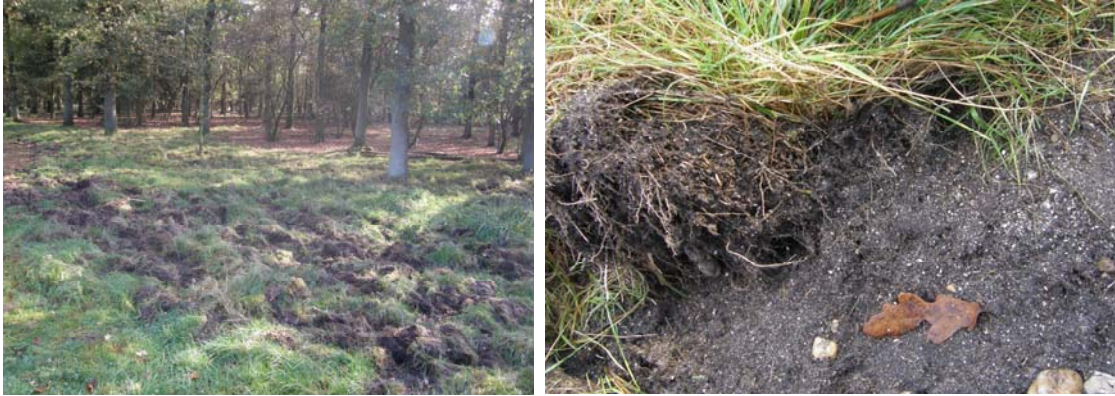
Figuur 6. Nationaal Verstrooiterrein Delbuizen. Links: bosgedeelte waarin op de voorgrond as is verstrooid, herkenbaar aan de dichte ondergroei. Het voorste gedeelte is recent door wilde zwijnen bezocht. Rechts: detail van door wilde zwijnen omgewoelde strooiplek met as.