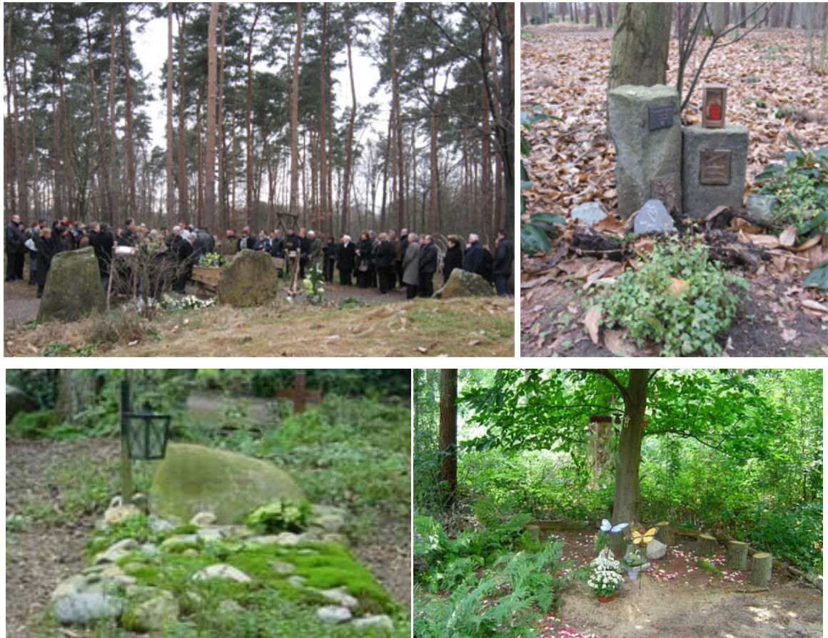
Figuur 1. Impressie natuurbegraafplaats Bergerbos.