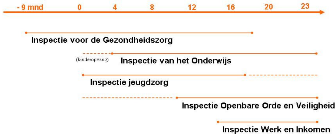
Figuur 1: Inspecties gerelateerd aan de levensloop van de jeugd

ITJ beoogt een bijdrage te leveren aan het versterken van de preventieve taak van algemene en specifieke voorzieningen voor de jeugd en daarmee aan het oplossen van maatschappelijke problemen van jongeren. Zij richt zich daarbij op de effectiviteit van de samenwerking van voorzieningen in de jeugdketen. Uiteindelijk zal deze effectiviteit zichtbaar moeten worden in reductie van het aantal jongeren dat als gevolg van een zwakke samenwerking tussen voorzieningen tussen wal en schip raakt of ontspoot. Dit zal bovendien tot maatschappelijke en economische inverdieneffecten (kunnen) leiden.