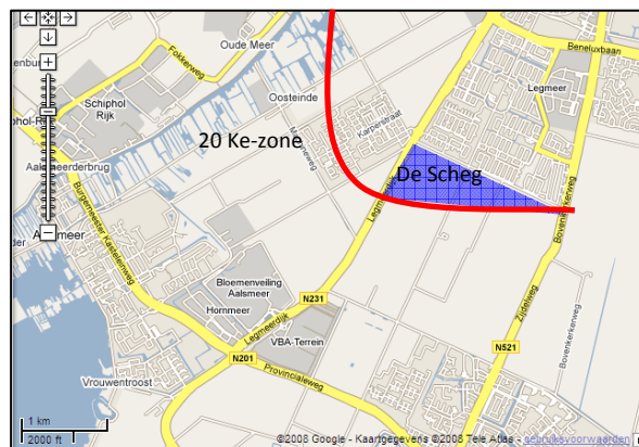
Figuur 1.2 Schematische ligging van uitsluitingsgebied De Scheg

Het deel van de Legmeerpolder dat buiten de 20 Ke-geluidzone valt, maar toch binnen het gestippelde gebied (3) ligt, wordt aangeduid als het uitsluitingsgebied De Scheg. In figuur 1.2 is dit gebied schematisch weergegeven middels de blauwe driehoek.