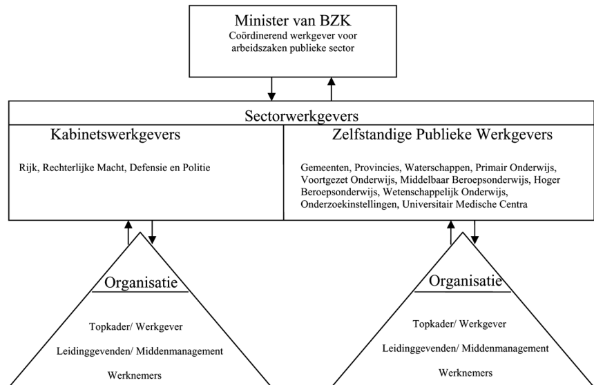
Figuur 1: Organogram publieke sector

Het kabinet Balkende IV heeft in het beleidsprogramma «Samen werken, samen leven» een viertal doelstellingen voor 2011 geformuleerd: